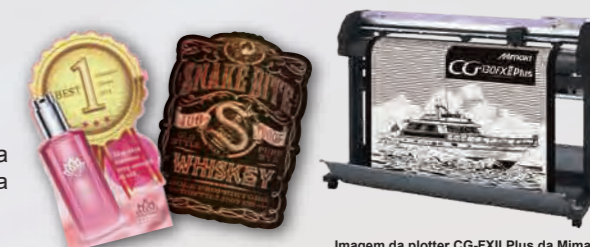
Imagem da plotter CG-FXII Plus da Mimaki

Quando a JV300-130/160 Plus é utilizada com a plotter CG-FXII Plus, a função ID Cut pode ser aplicada, possibilitando eficiência do trabalho e uma variedade de aplicações.