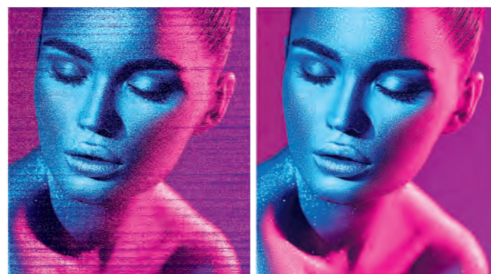
Impressão sem ajuste

O novo sistema DAS alinha automaticamente* o posicionamento dos pontos na impressão Bidirecional e a alimentação da mídia, reduzindo assim, o tempo de trabalho.